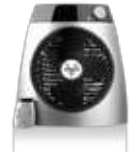
WHOLE ROOM HEATERS